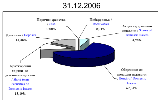
Слика 6: Структура на инвестициите на КБ Прв