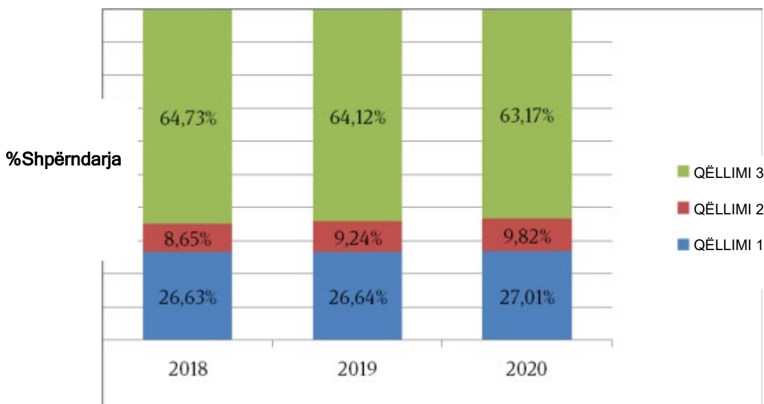
Grafik: Shpërndarja e mjeteve buxhetore në pajtim me qëllime

Pjesa më e madhe ose rreth 56,3% të mjeteve të përgjithshme të planifikuara që janë të dedikuara për realizimin e Qëllimit 3. Arsyeja kryesore për të cilën qëllimi i tretë përfshinë një pjesë të madhe të buxhetit të MAPAS është se ky qëllim është i lidhur me zhvillimin e kapacitetit institucional të MAPAS, që planifikohet vazhdimi me periudhën trevjeçare në fjalë. Sipas shpërndarjes e shpenzimet, për realizimin e pjesës së parë janë planifikuar 23,5% ndërsa për qëllimin e dytë 8,1% të mjeteve të planifikuara në përgjithësi.